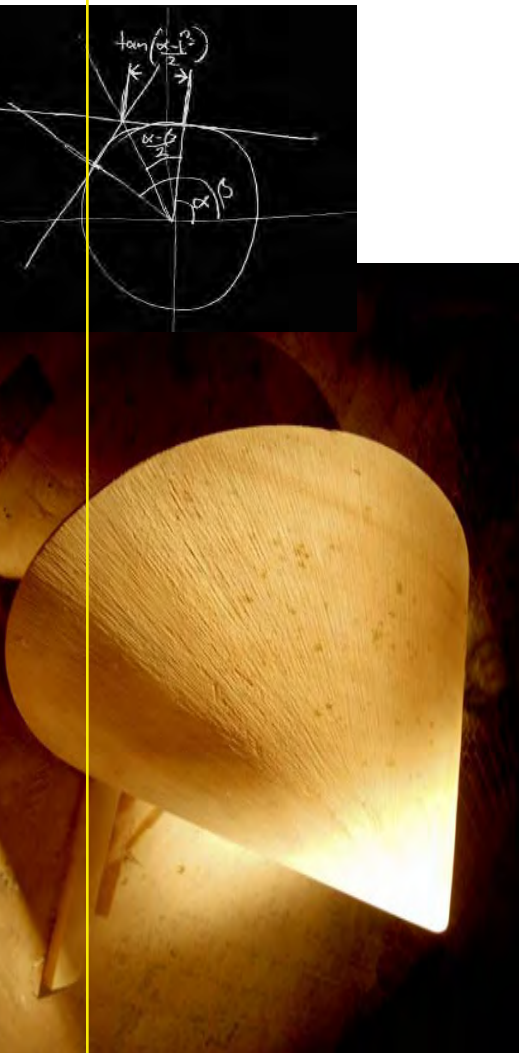
Abb. oben: Oloid in Farbpigment Abb. mitte: Aus Sandstein gefertigter Oloid Grafik: Stephan von Borstel, Kassel - www.svborstel.de